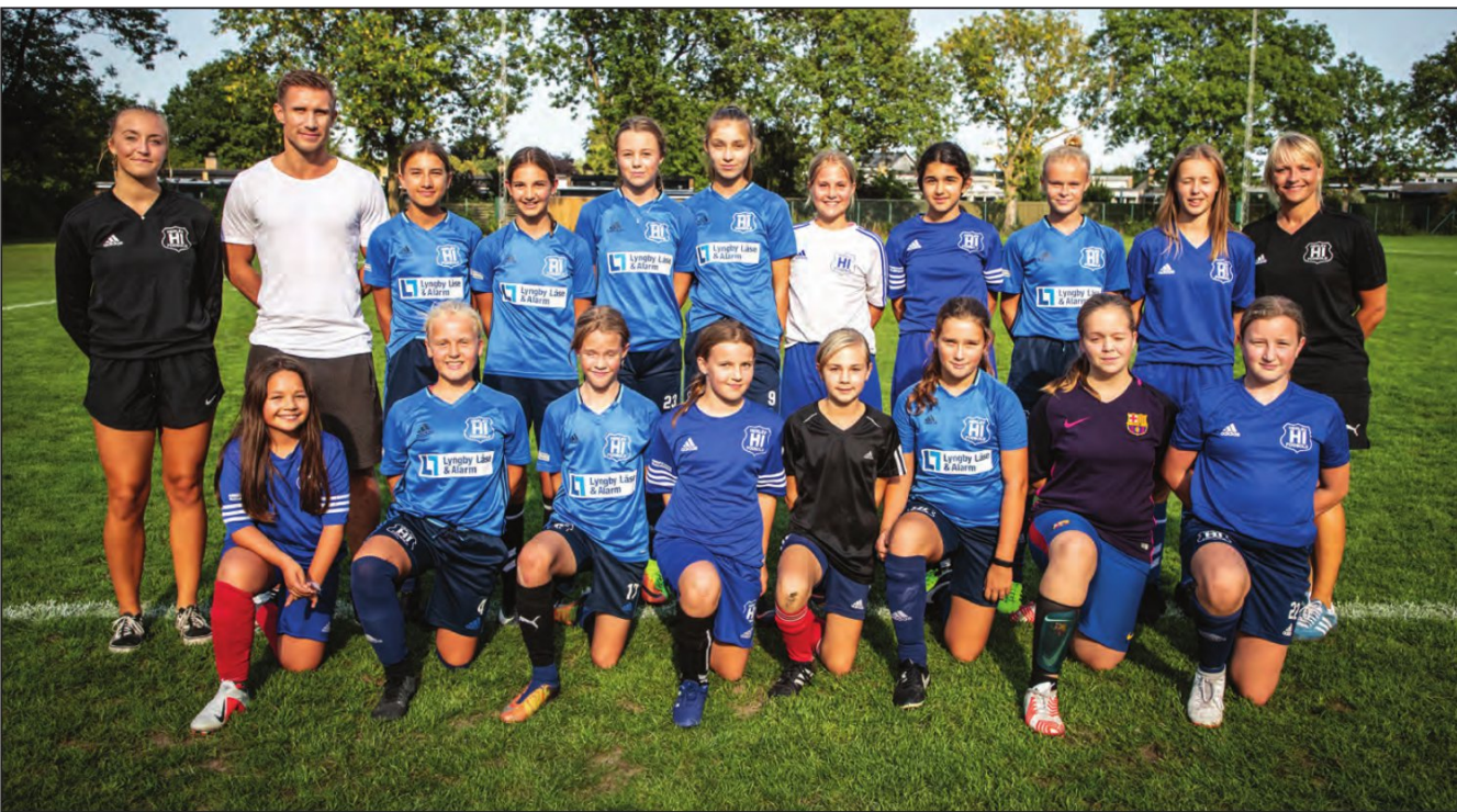
HOLDET. Med matchende trøjer og navne på ryggen tropper spillerne op til træning to gange om ugen.